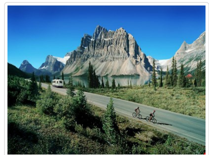
歷經風吹冰蝕所造成的城堡山

貼心規劃 【笑傲山林篇】：鳳凰旅遊安排國內班機，由溫哥華飛卡加利，讓您同日抵達國家公園住宿，節省九百公里以上的舟車勞頓，就是要您減少旅途奔波，細細品味這世界級絕世山林美景，讓您悠閒暢遊洛磯山脈。