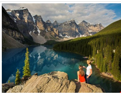
加拿大紙幣上的風景 - 夢蓮湖

早上前往機場轉機飛往亞伯達省第一大城 - 卡加利，此城兼具牛仔風味與現代都市風情，由於石油天然氣的開發，讓卡加利成為大草原上商業繁盛的水泥森林，是北美地區石油重鎮。沿著 1 號楓葉國道高速公路，行經一九八八年冬季奧林匹克運動公園後，慢慢進入無盡的曠野，遠方以洛磯山脈為背景的天際線漸入眼簾，不久抵達加拿大第一座國家公園 - 班夫國家公園。午後，前往瑪麗蓮夢露拍攝電影“大江東去”的著名場景◎弓河瀑布，來到◎驚奇角遠眺弓河谷地及以群巒疊翠為背景的百年班夫溫泉城堡。並安排搭乘玻璃觀景★纜車，登上海拔高度 2281 公尺的硫磺山，居高臨下，不但可以一覽班夫全景，還能環視四周雄偉群山，山頂常見到大角羊等野生動物。晚餐後，您可自由前往班夫大道上的精品櫥窗一逛，體驗山中小城風情，今晚住宿班夫鎮上旅館。