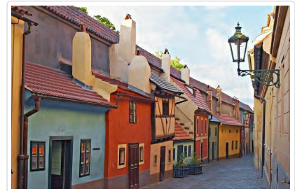
卡夫卡的黃金小巷