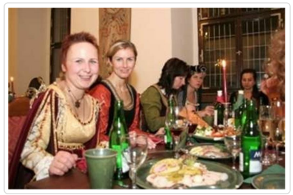
中古世紀宴+換裝體驗