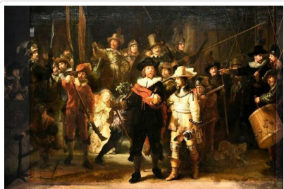
國立博物館—鎮館之寶

美麗的鬱金香、浪漫的運河、隨處可見的腳踏車、閃亮的鑽石、珍貴的藝術收藏以及心胸開放的國民，吸引世界各地的遊客，多元的文化更是這個城市進步的動力。早餐後前往市區參觀阿姆斯特丹最大的博物館（欣賞林布蘭名聞遐邇的「夜巡」、維米爾「拿著水罐的女人」等豐富館藏，一覽歐洲北方文藝復興藝術。阿姆斯特丹★國立博物館（一覽歐洲北方文藝復興藝術）中午返回市區參觀搭乘★玻璃船悠遊大小運河，飽覽市區多樣建築景色，感受悠閒浪漫風情。另以「鑽石之都」聞名的阿姆斯特丹，精彩的◎鑽石切割表演及展示，更是不可錯過！阿姆斯特丹市區著名的◎水壩廣場：12世紀時此地居民在阿姆斯特河上建造了一個小水壩(DAM)並聚集定居，後逐漸發展成為商業城市，阿姆斯特丹城市名稱因此而來。原水壩的位置就是現在的水壩廣場，位於市中心黃金位置又擁有醒目的建築物和頻繁的活動而著名，為阿姆斯特丹中心最熱鬧繁華的地段。一旁的◎舊王宮：原為17世紀荷蘭黃金時代為了彰顯城市繁榮所建的市政廳，後因路易·拿破崙擔任荷蘭國王時指定為國王住所而改建得美輪美奐。其最大特色為使用13659根木材打樁，使建築物不會下沉，為當時的建築奇蹟。水壩廣場附近還有成立於1870年，荷蘭知名的連鎖百貨公司De Bijenkorf女王百貨公司，彙集了眾多全球知名高端品牌HERMES、LV、GUCCI、BV、Balenciag 時尚精品一應俱全，為這個國際化的都市吸引了更多的全球時尚追隨者，讓人彷彿見到當年商賈雲集、名流穿梭的輝煌時代風貌。