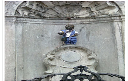
最長壽比利時公民—尿尿小童