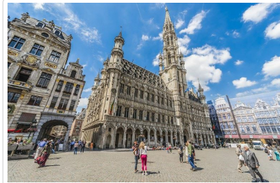
布魯塞爾—黃金大廣場