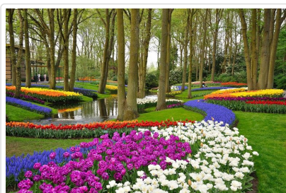
一年一度盛開★庫肯霍夫花園

(註1.: 今明日行程豐富精彩，配合花園入內及遊船預約時間，順序可能會前後調整，請知悉每個景點都會走到。 註2：花朵綻放程度取決於天氣和濕度，開花程度為自然現象，若遇花況不佳非本公司能決定，以現場實況為準，請以開放的心態來欣賞景緻，感謝瞭解。 ★玻璃船 悠遊大小運河，飽覽市區多樣建築景色，感受悠閒浪漫風情。另以「鑽石之都」聞名的阿姆斯特丹，閃爍的 ◎鑽石切割與展示 ，更是不可錯過！(註:本日行程配合遊船預約時間，順序可能會前後調整，但每個景點都會走到，敬請知悉)