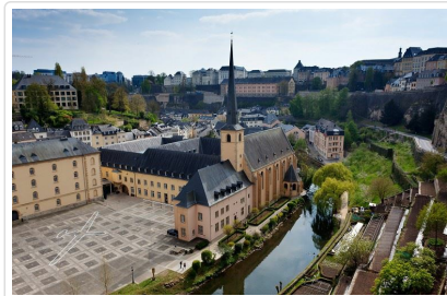
世界最富有國—盧森堡