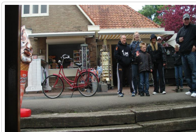
小鎮親切的居民們