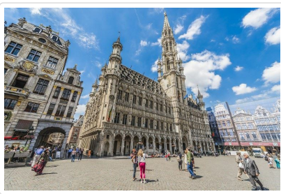
布魯塞爾黃金大廣場