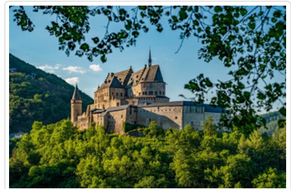
維安登古堡「小瑞士」美譽