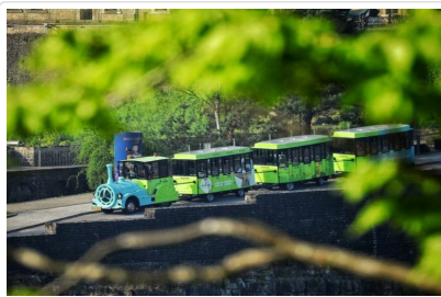
小火車遊盧森堡古城

★維安登古堡位於烏爾河谷旁小山丘的制高點，距離盧森堡市30公里，為盧森堡最珍貴的歷史建築之一。城堡是以公元四世紀羅馬帝國時期要塞所改建，隨著年久失修成殘垣斷壁，到了1977年歸盧森堡大公國所有後，才重新修繕成博物館對外開放。維安登小鎮除了這座著名的城堡以外，也因法國大文豪維克托雨果曾經在這裡居住過近10年而聞名。雨果曾在1862年到1871年間三次流放到此，加之這裡景色優美，更有「小瑞士」之稱。續專車前往五星城堡莊園飯店，優雅的環境讓您留下美好回憶。