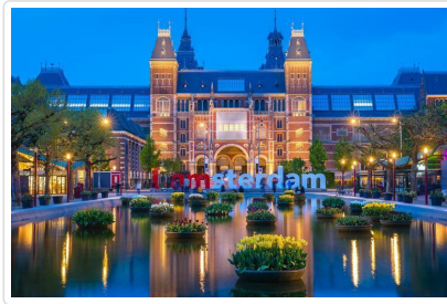
入內國立博物館一覽文藝復興