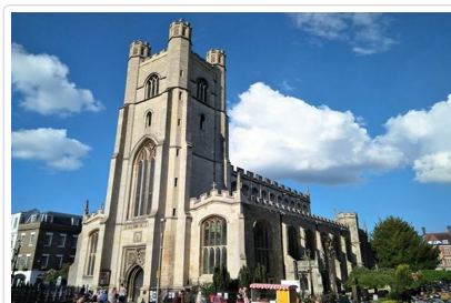
劍橋大聖瑪莉教堂