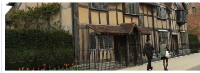
莎翁故居入內參觀