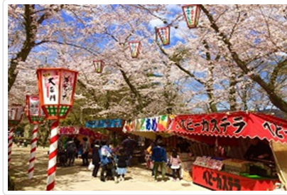
公園百選～打吹公園