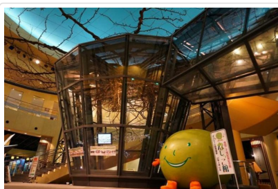
二十世紀梨紀念館

註2：行程表中列明之住宿順序僅為先行提供給貴賓參考，請依當團行前說明會公佈之正確資料為準。