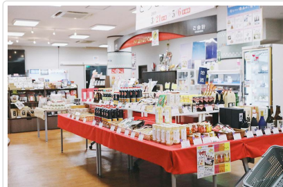
鳥取市國際觀光物產中心