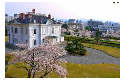
鳥取城跡・久松公園