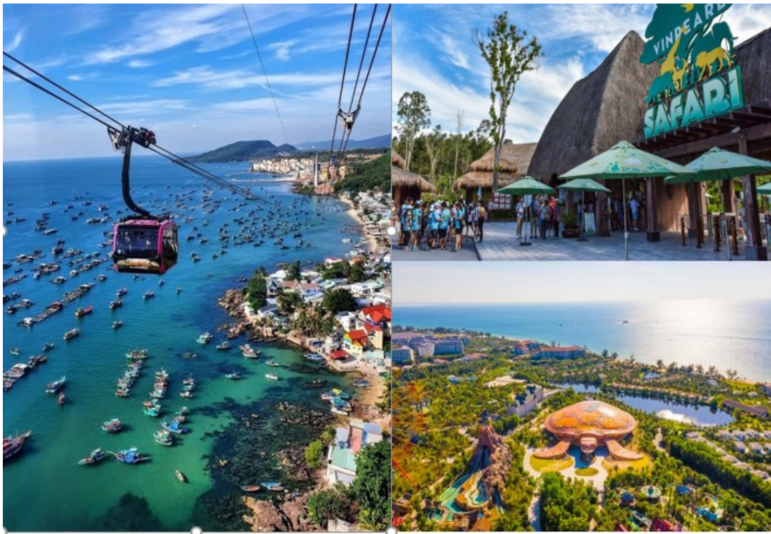
盡享海濱風情~富國島(Phu