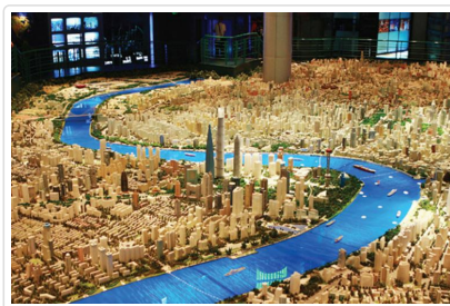
上海城市規劃展示館