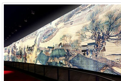
電子版清明上河圖

🍴 餐食 早餐：飯店內 午餐：人和館~肇嘉濱路店(2024米其林一星)300 晚餐：X