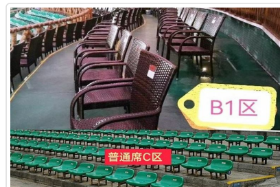
劉三姐B1席(圖上)一般席(圖下)

特殊安排 灘江遊船特別指定第二層座位，視野極佳，是拍攝山水美景和感受船在江中走，人在畫中游的絕佳位置。