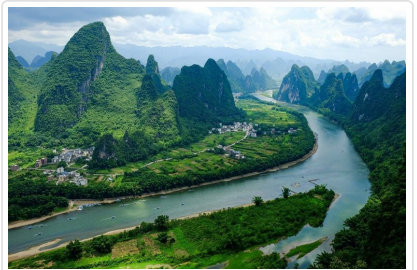
相公山 俯瞰瀘江第一灣