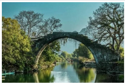
遇龍河竹筏漂流 富里橋