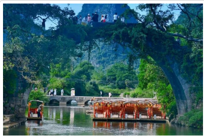
遇龍河竹筏漂流 富里橋