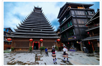
程陽八寨 侗族鼓樓

行車距離 桂林 - 程陽八寨景區 車程約2小時 / 程陽八寨景區 - 三江 車程約30分鐘