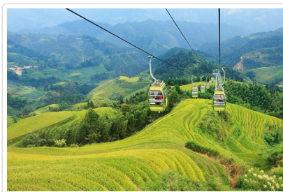
龍脊 金坑梯田 金佛頂纜車