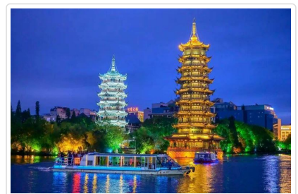
夜船遊四湖 日月雙塔

特殊安排 夜船遊四湖安排★專屬包船，免去與其他團體共乘的喧擾，搭配★茶點，讓您在航程中邊品茶點邊賞景，細細品味桂林的夜之美。